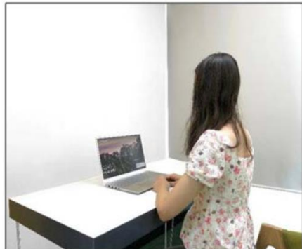
图3：侧后方第二机位效果图